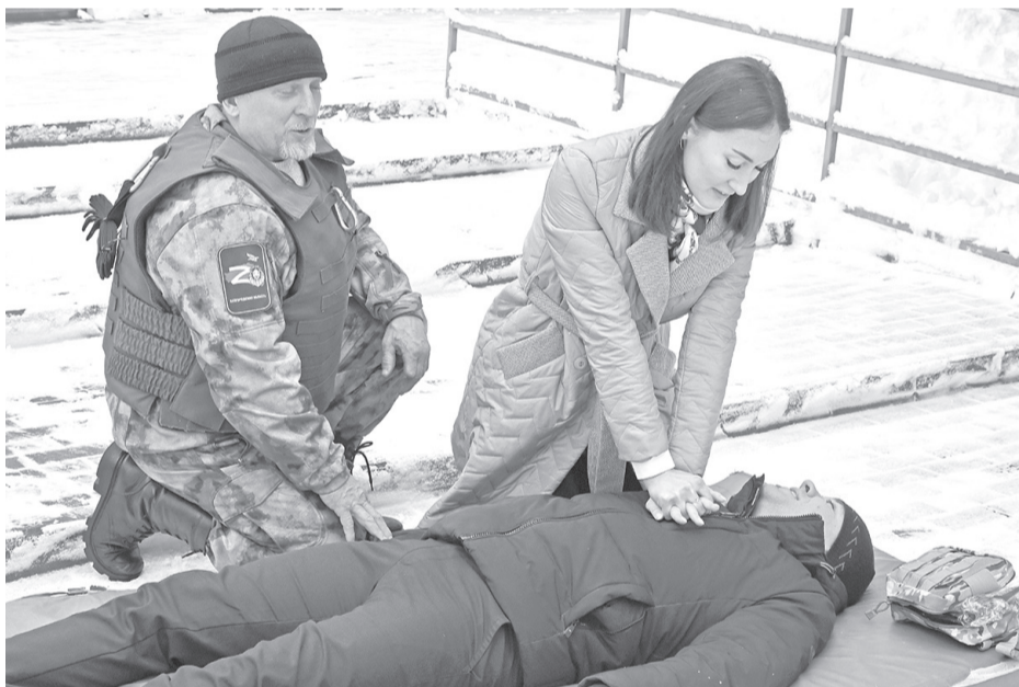
Учения по гражданской и территориальной обороне в посёлке Борисовка

ВСЕ ЖЕЛАЮЩИЕ ЕЩЁ МОГУТ ПРОЙТИ ОБУЧЕНИЕ ПО ОСНОВАМ ОКАЗАНИЯ ПЕРВОЙ ПОМОЩИ