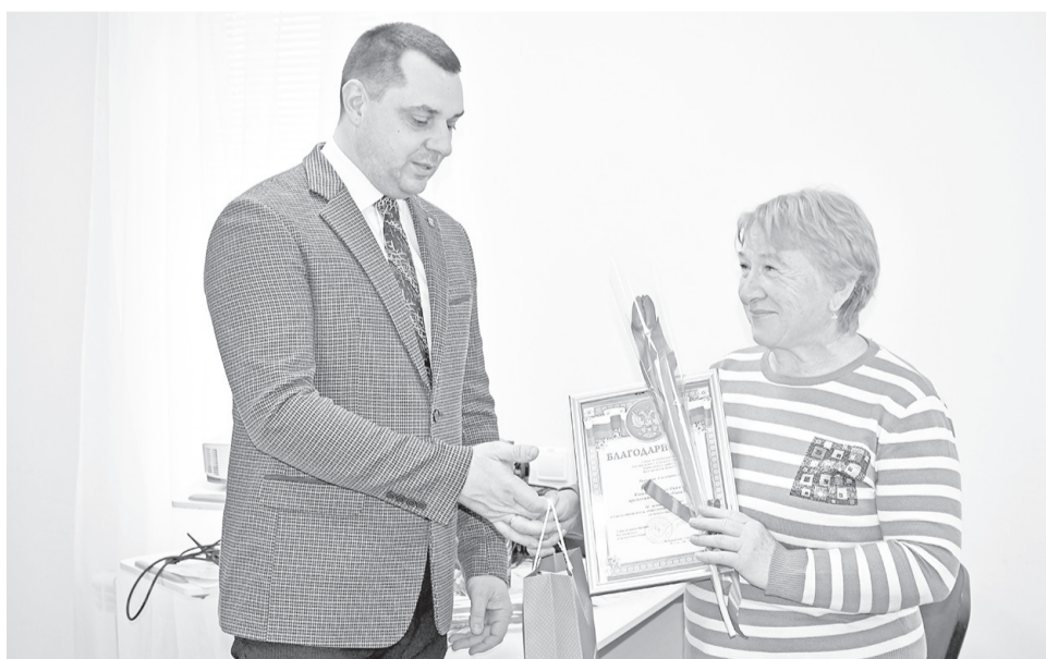
Награждение активистов и общественников

Администрация сельского поселения совместно с депутатским корпусом и активистами в течение всего прошлого года старалась поддержать уровень социально-культурного развития поселения. Немаловажную роль при решении вопросов обес-