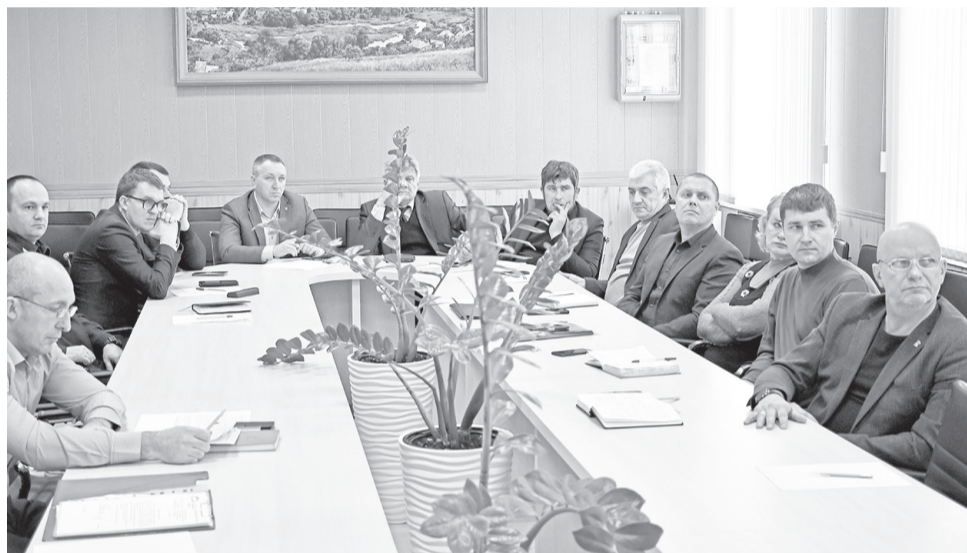
Участники заседания межведомственной рабочей группы

пренебрежительнейшей истории – сердечные приступы у хозяев подсобного хозяйства, колоссальный ущерб для семейного бюджета и мечты о самой дешёвой колбасе хотя бы под Новый год.