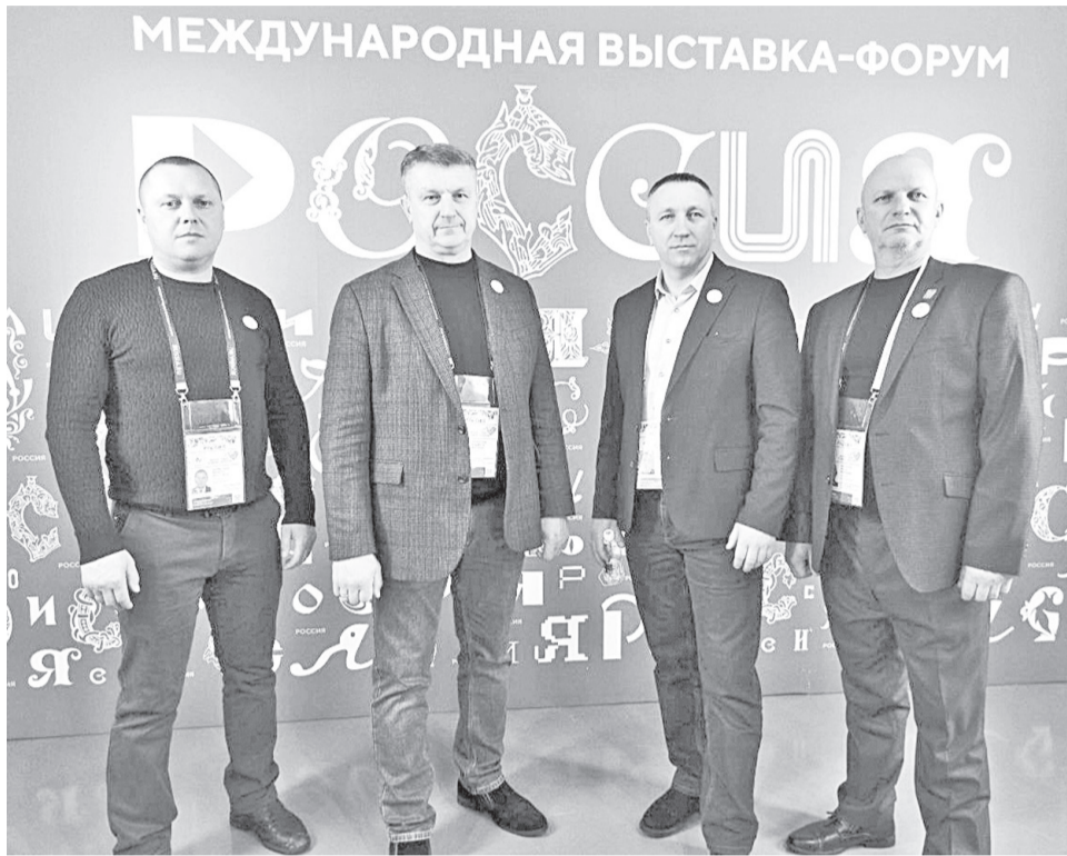
Делегация Борисовского района

Все муниципальные образования России были представлены в одном месте, чтобы пообщаться, поделиться опытом, подружиться и найти новые пути развития своих муниципальных образований. В этом году обсуждения на форуме проходили по трём основным тематическим трекам: «Сила в традициях», «Сила в людях», «Сила в развитии». Он получился поистине масштабным: за один день на 35 площадках выступило более 250 экспертов, среди которых представители федеральных ведомств, крупных отечественных корпораций и общественных институтов. В течение дня прошло 64 деловых события: 3 панельные дискуссии, 32 круглых стола, 24 лекции и многое другое. Также состоялась презентация 5 проектов ВАРМСУ, одним из которых является цифровой портал Муниципалитеты.рф. Президент России Владимир Путин