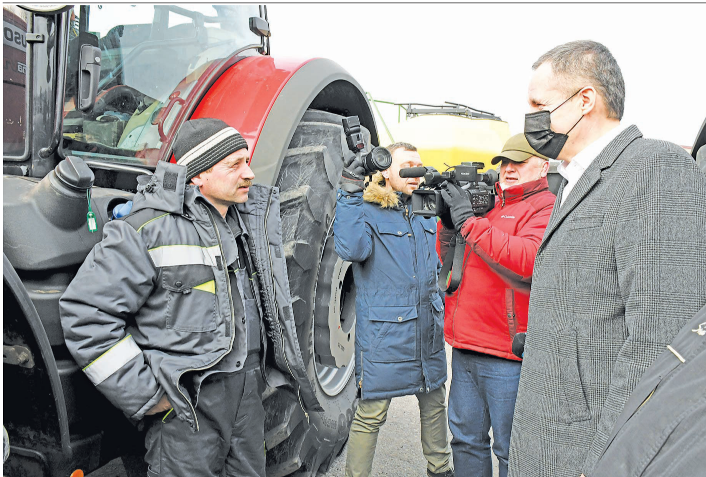
Вячеслав Гладков в ходе рабочего визита осмотрел машинно-тракторный парк Борисовской зерновой компании