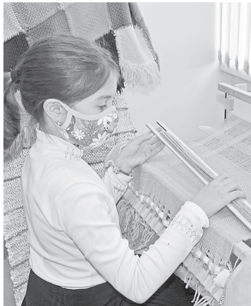
Знакомство с ремеслом