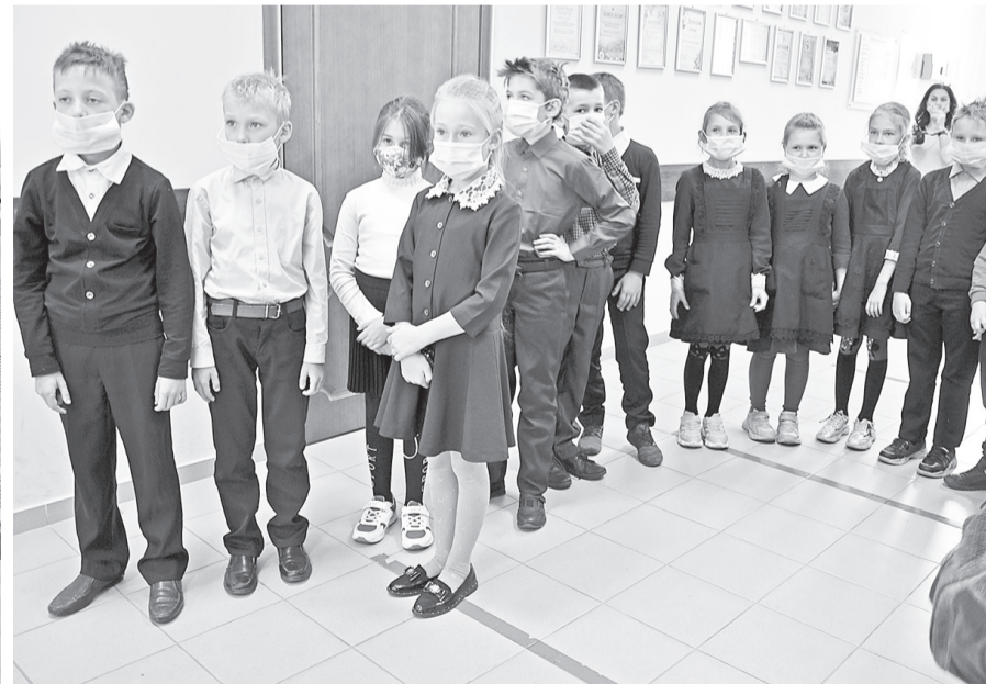
Гостями Дня ткача «Харитины – первые холстины» стали школьники