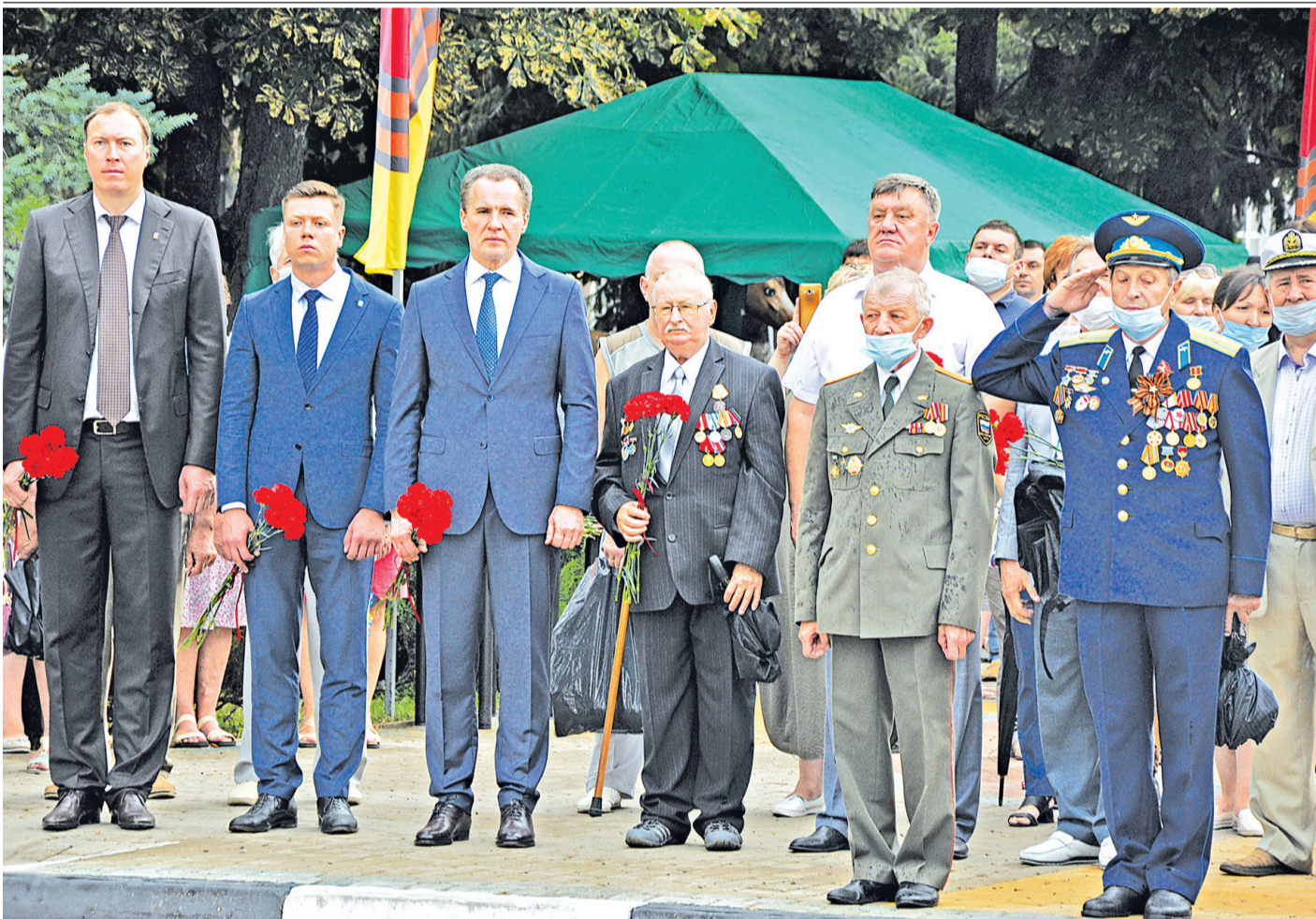
Вячеслав Гладков и почётные гости на траурном митинге