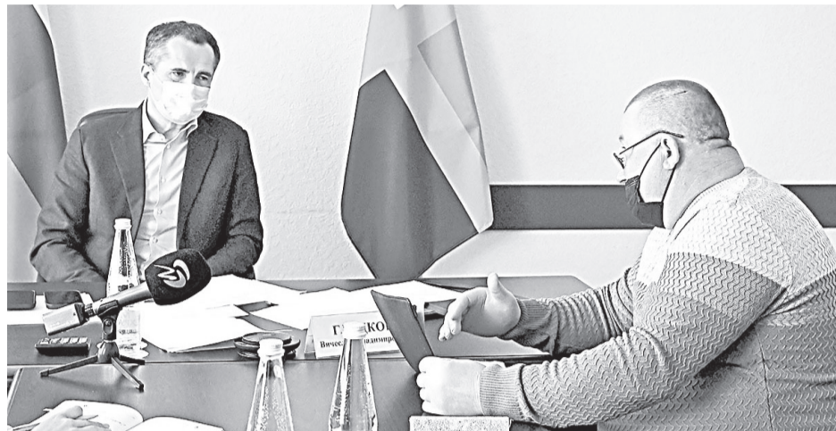
Житель села Байцуры на приёме у Вячеслава Гладкова

— Мы учреждения образования закрывать не планировали, не планируем и не