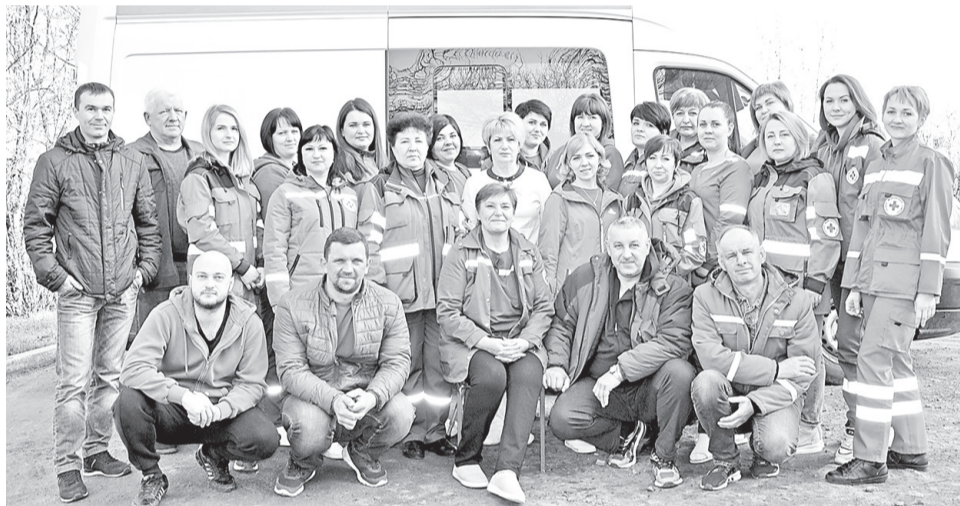
Коллектив работников скорой медицинской помощи Борисовского поста

– Перед всеми работниками стоят свои задачи. Например, у нас есть медицинские сёстры, которые входят в состав бригады и выезжают на вызов к пациентам для оказания скорой помощи больным или пострадавшим. Другие специалисты среднего медицинского персонала работают на приёме вы-