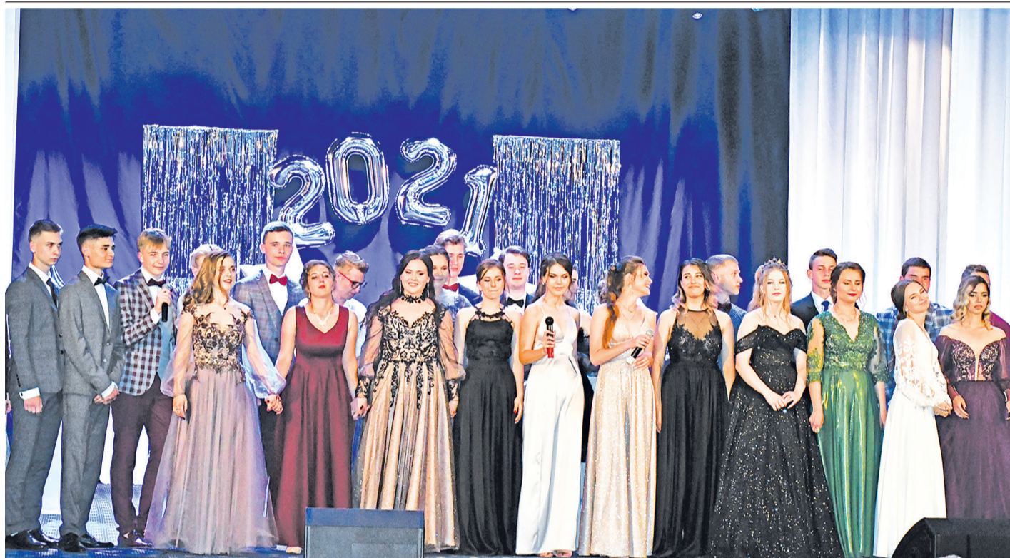
Выпускники Борисовской школы им. А.М. Рудого на сцене ЦКР «Борисовский»