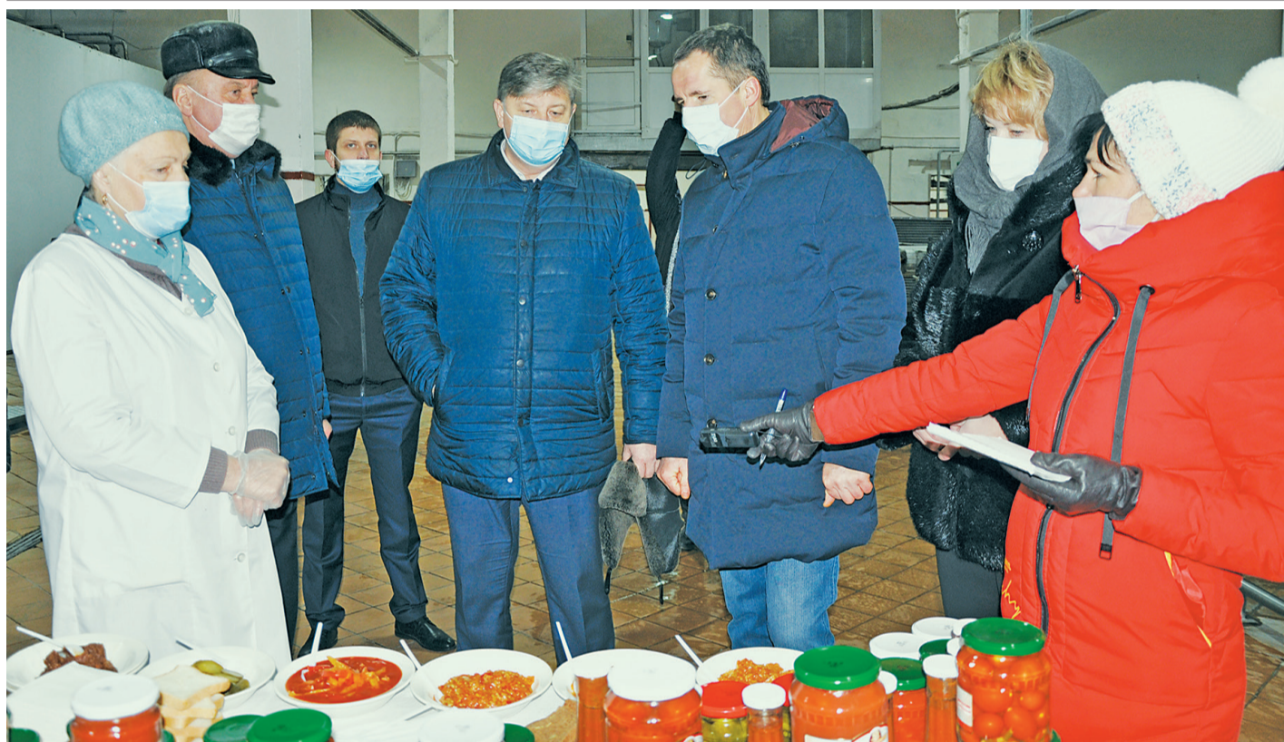
Врио губернатора Белгородской области Вячеслав Гладков во время визита в Борисовский район посетил ПК «Русь»