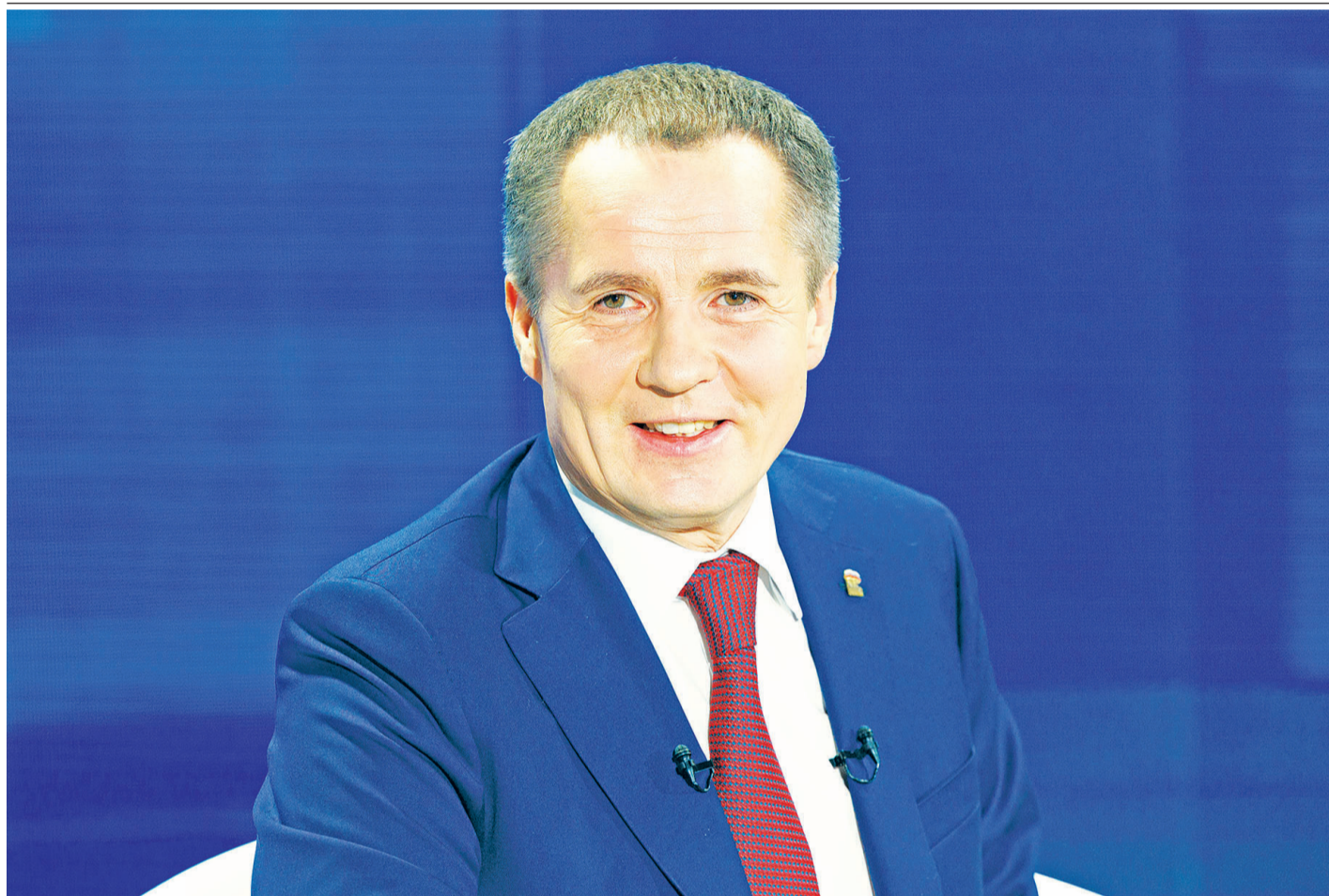
Вячеслав Гладков на пресс-конференции с журналистами