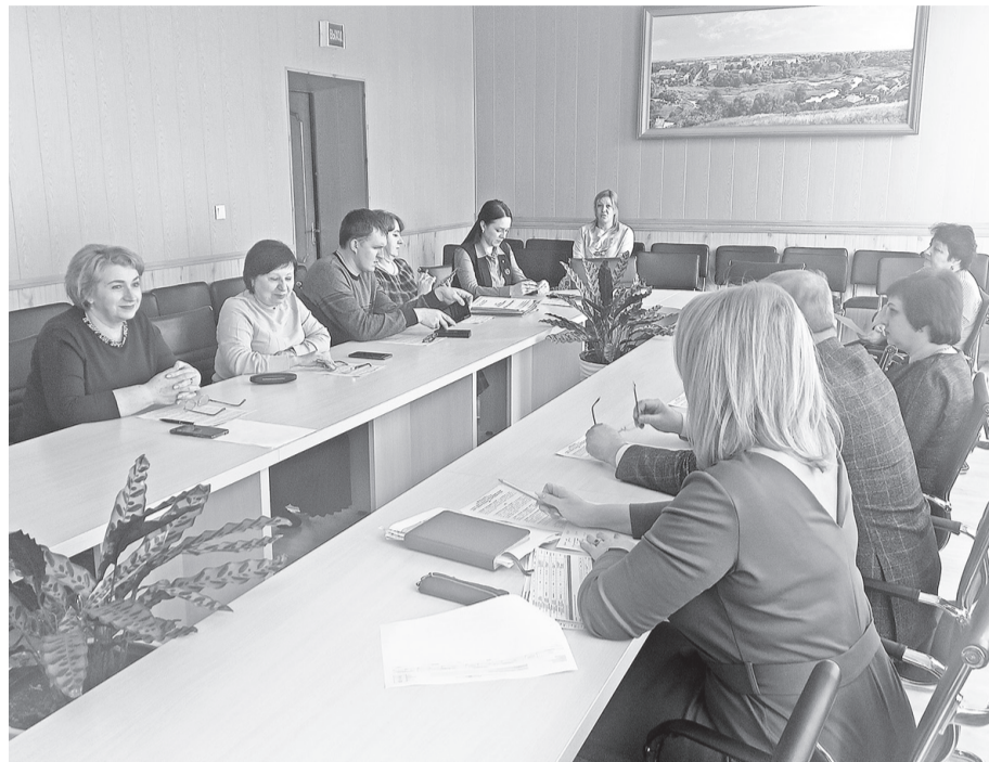
Участники заседания комиссии по предоставлению государственной социальной помощи гражданам на основе социального контракта