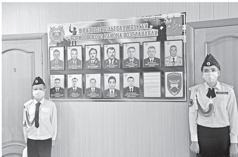
Кадеты у открытой памятной доски в преддверии Дня ГИБДД