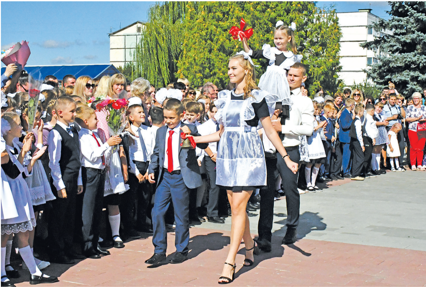
На Дне знаний в Борисовской школе №2