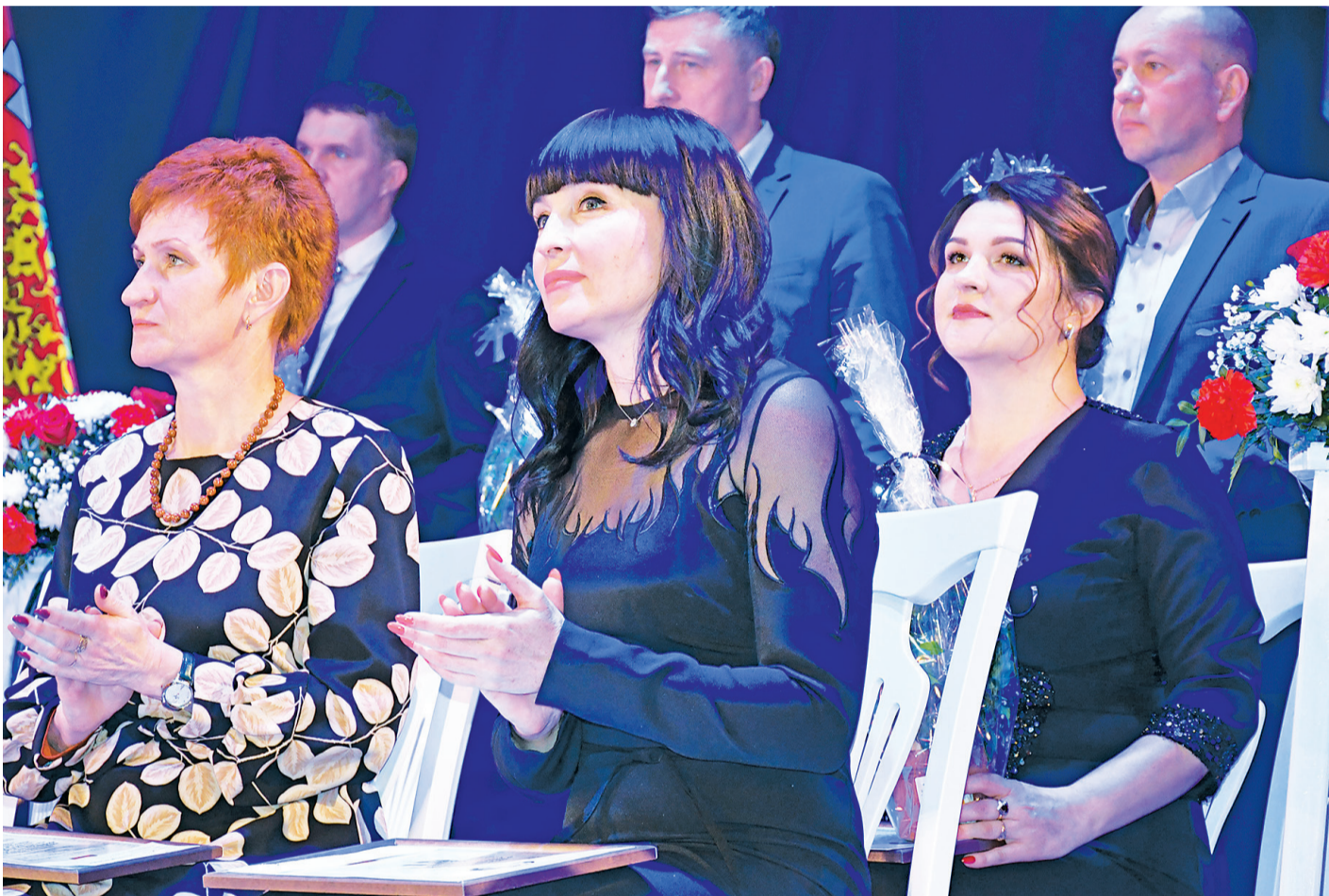
Участники торжественного собрания, посвящённого подведению итогов социально-экономического развития района за 2020 год