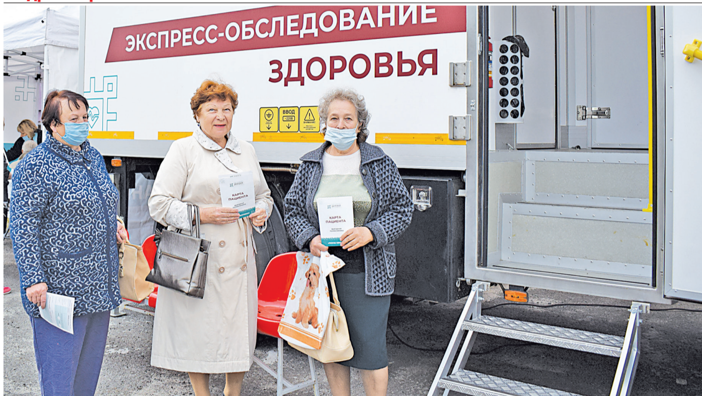
Посетители передвижного медицинского комплекса «Поезд здоровья»