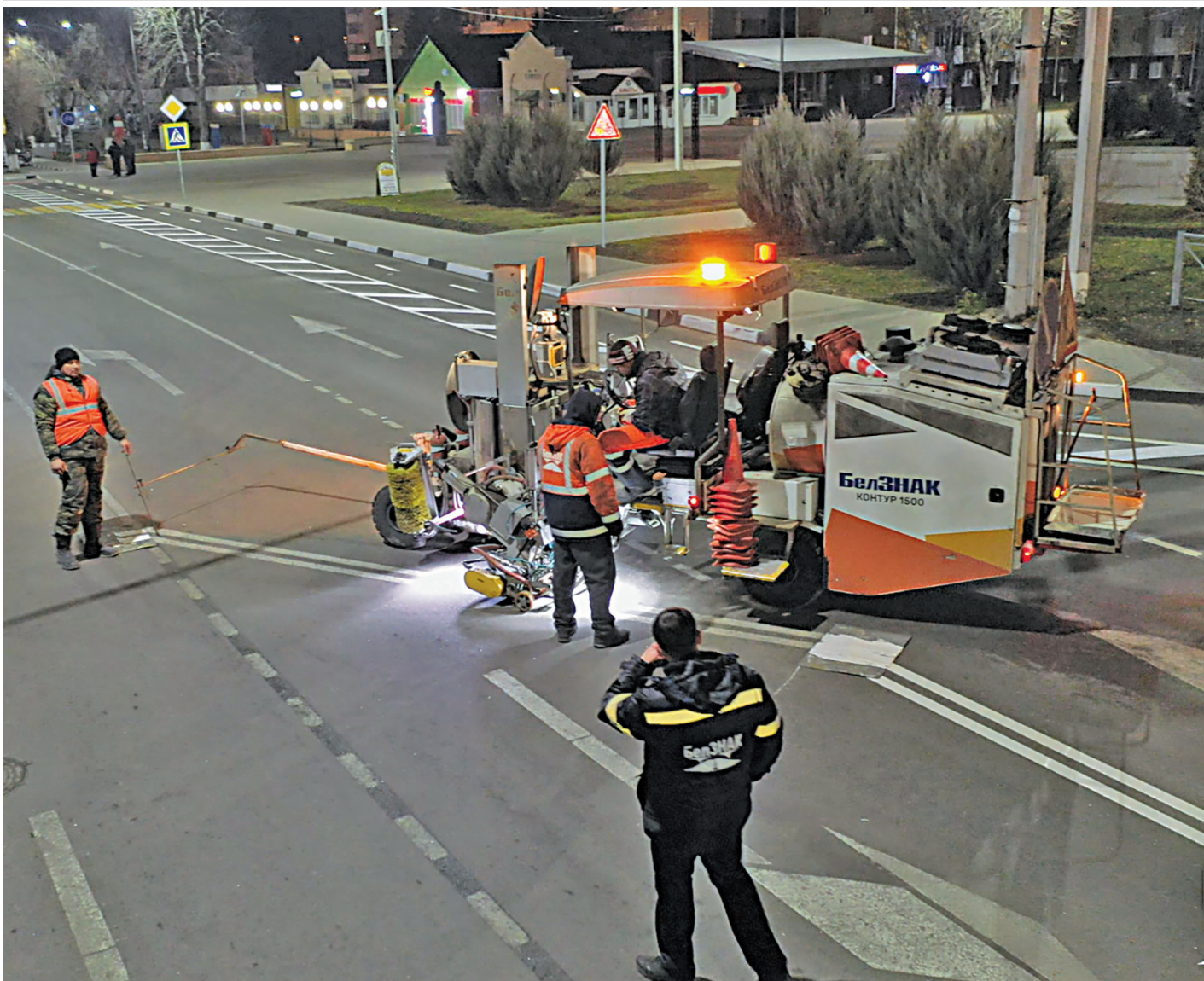
Разметка улицы Советская

У вас есть новость? Вы обладаете интересной информацией или стали очевидцем необычного? Звоните 8 (47246) 5-13-13 Пишите bor4894@yandex.ru