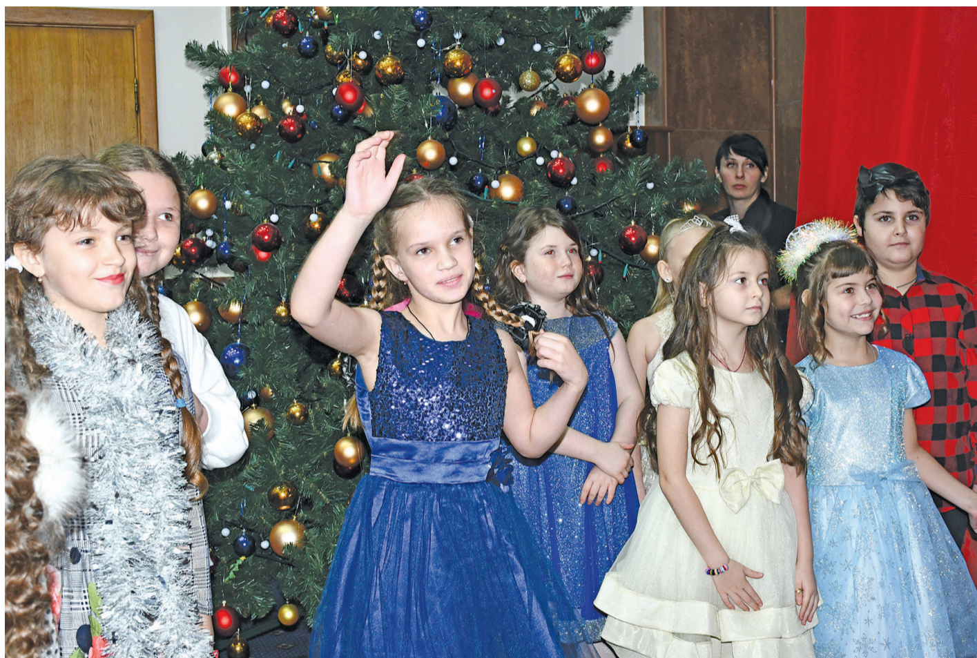
Участники ёлки главы администрации Борисовского района