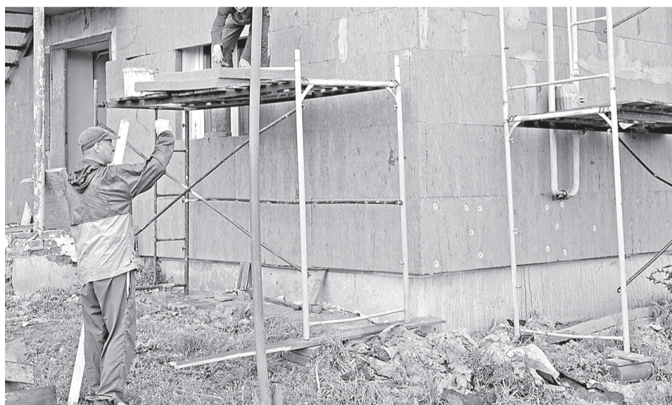
Строительные работы по утеплению фасада здания многоквартирного дома в селе Грузское

БЫВШИЕ ОБЩЕЖИТИЯ КАПИТАЛЬНО РЕМОНТИРУЮТСЯ В БОРИСОВСКОМ РАЙОНЕ