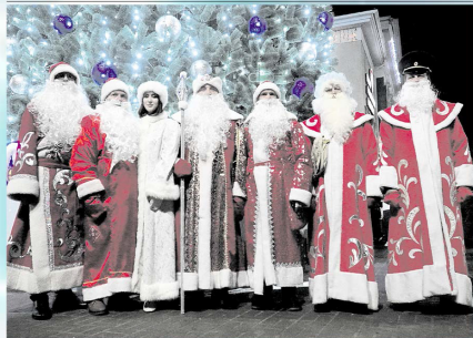
Открытие ёлки в поселке Борсовке