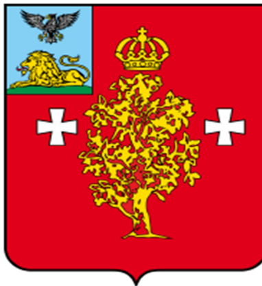
СХЕМА ТЕПЛОСНАБЖЕНИЯ Березовского сельского поселения муниципального района «Борисовский район» Белгородской области до 2028 года