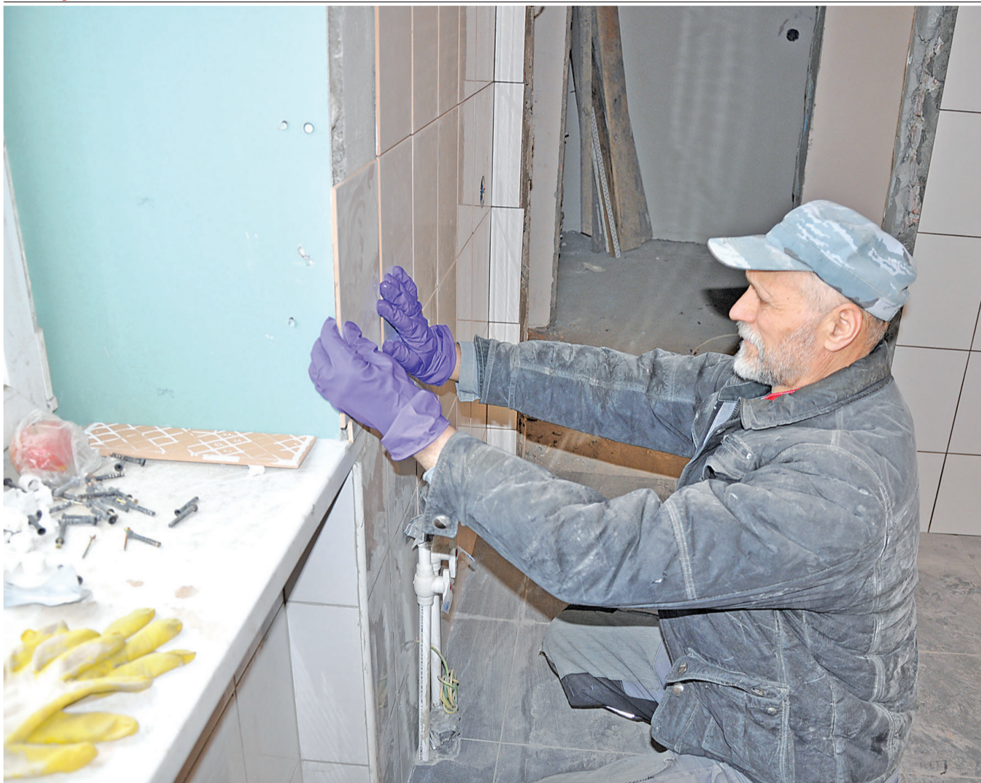
Выполнение плиточных работ в Стригуновском детском саду