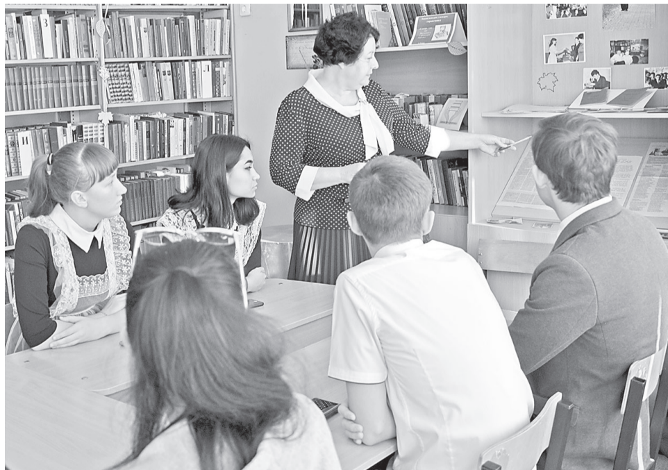
Урок в открывшейся библиотеке