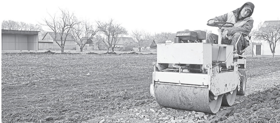
Строительство беговой дорожки на спортивной площадке в селе Берёзовка