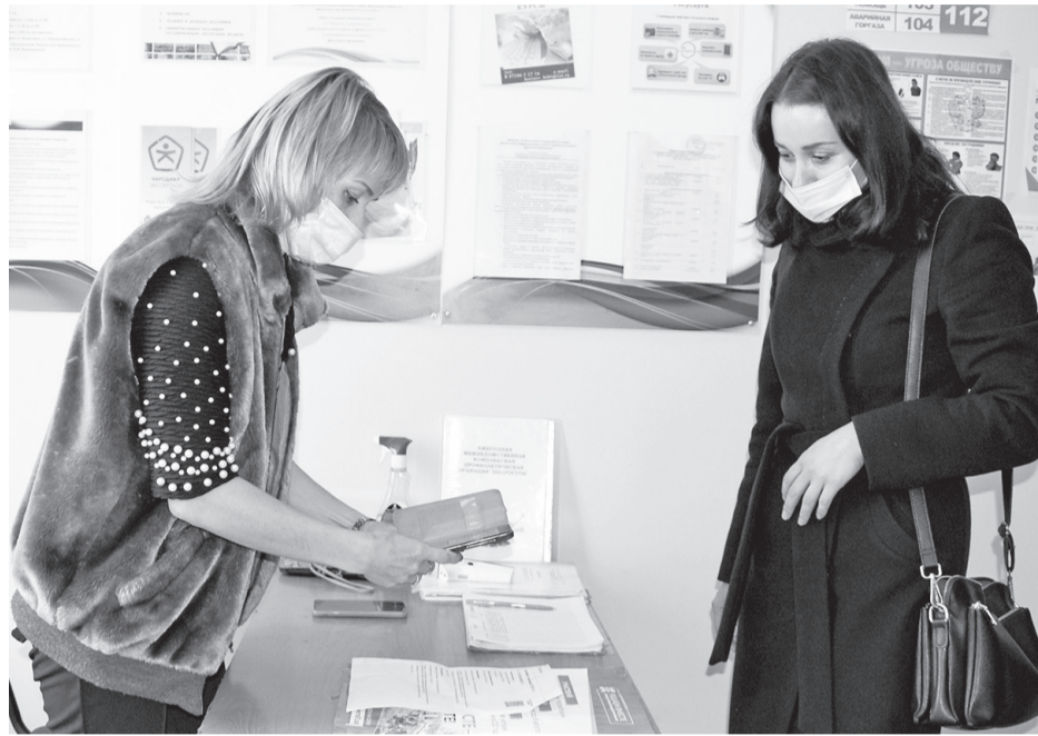
В центральной библиотеке Борисовского района имени П.Я. Барвинского опробировали приложение, считывающее QR-коды

- После считывания QR-кода в приложении появляются минимальные данные посетителя: его инициалы, дата рождения. Исходя из этого, мы спрашиваем у человека данную информацию, чтобы убедиться в том, что QR-код принадлежит именно ему, - рассказала научный