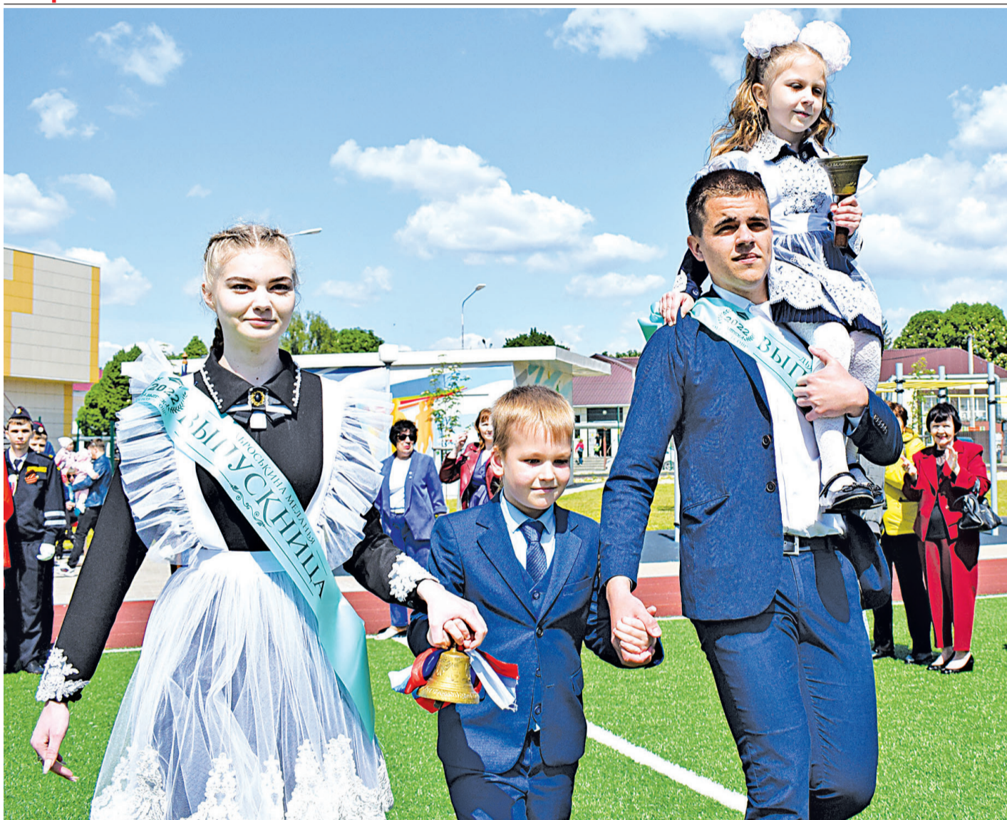
Последний звонок возвестил об окончании школы