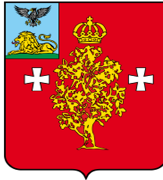
СХЕМА ТЕПЛОСНАБЖЕНИЯ БЕРЕЗОВСКОГО СЕЛЬСКОГО ПОСЕЛЕНИЯ МУНИЦИПАЛЬНОГО РАЙОНА «БОРИСОВСКИЙ РАЙОН» БЕЛГОРОДСКОЙ ОБЛАСТИ