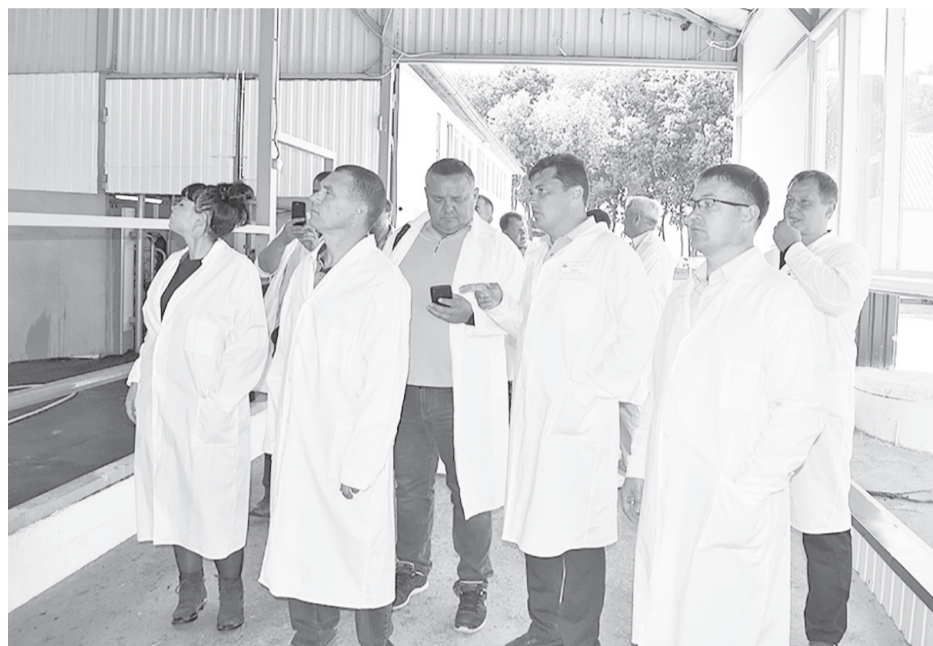
Во время визита делегации аграриев из Курганской области

полезна. Мы благодарны белгородцам за организацию визита и возможность подробно ознакомиться с их опытом развития отрасли. Не только надеемся на продолжение отношений, но и со своей стороны приглашаем вас к нам в гости, –