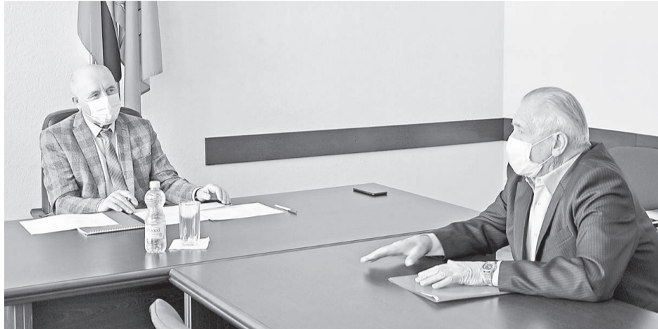
Во время приёма граждан в администрации Борисовского района

Житель Акулиновки пришёл на приём с вопросом получения гражданства Российской Федерации и паспорта. Из-за не-