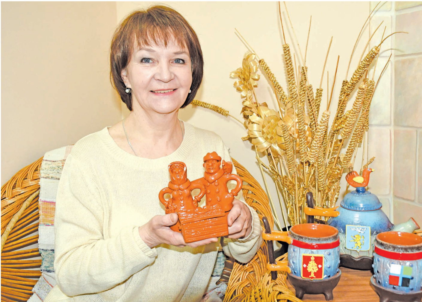
Народный мастер России Ирина Семихина