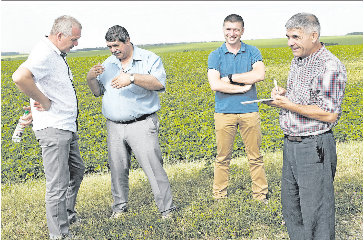
Участники объезда полей