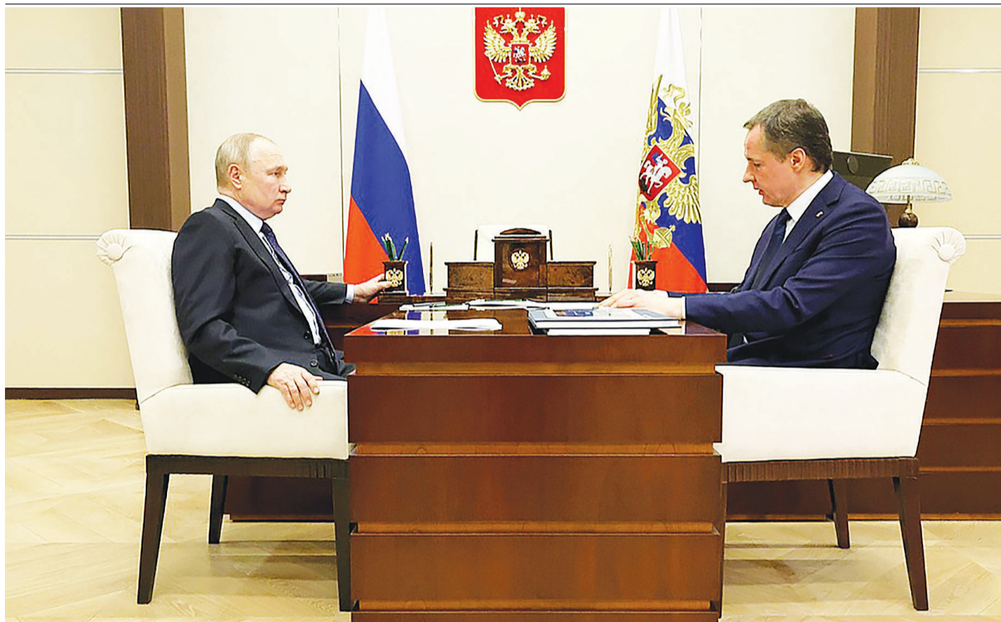
Президент России Владимир Путин провёл встречу с Губернатором Белгородской области Вячеславом Гладковым