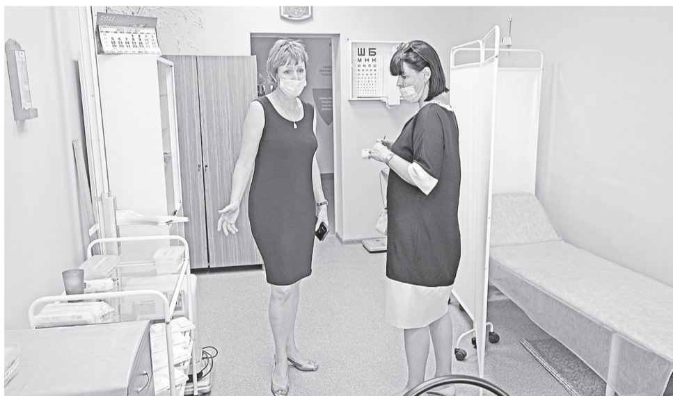
Приёмка медицинского кабинета в Борисовской школе №2