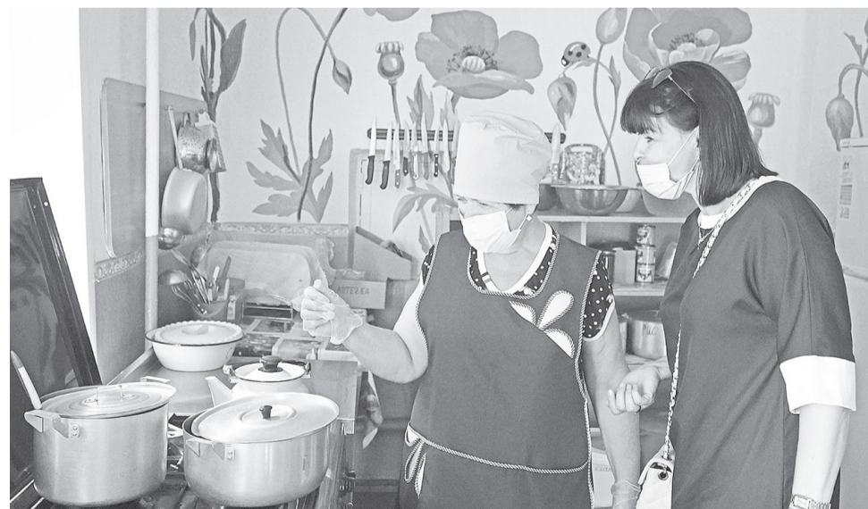
В Грузчанском детском саду