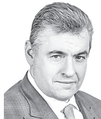
СЛУЦКИЙ Леонид Эдуардович