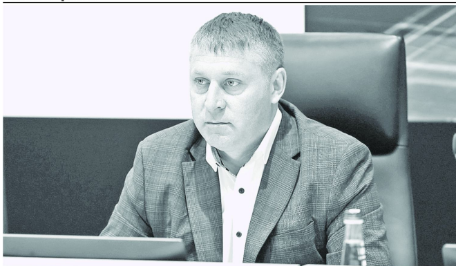
Врио губернатора Белгородской области Александр Шуваев