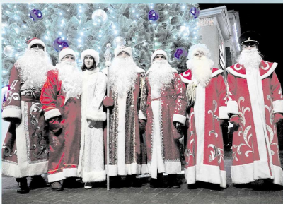
Открытие ёлки в Борисовке