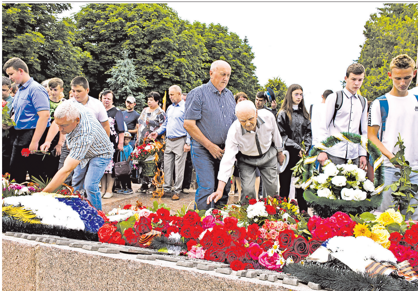
Возложение цветов и венков к Вечному огню в Борисовке