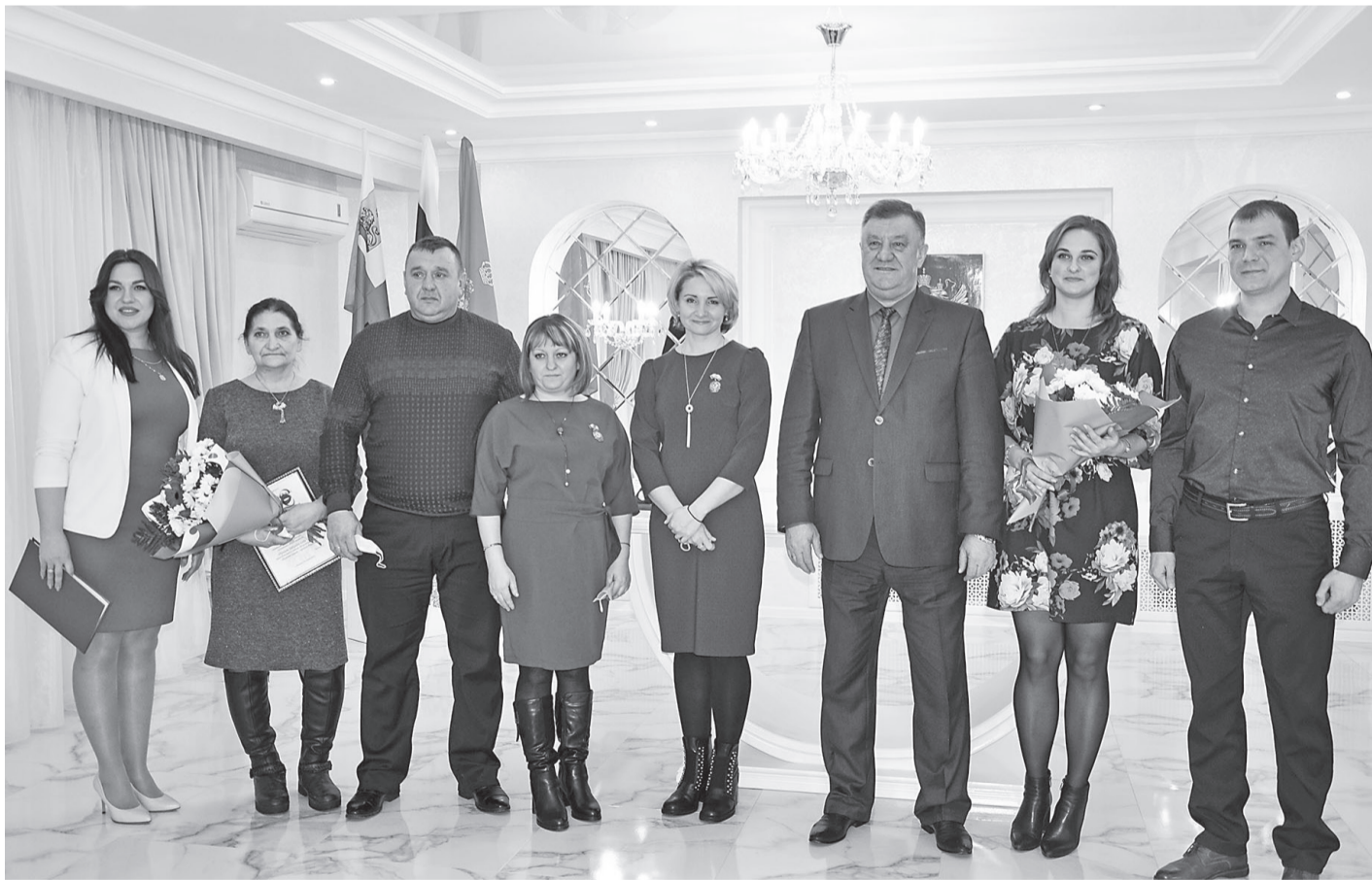
Участники церемонии награждения многодетных семей