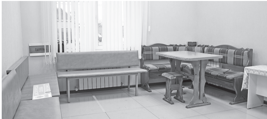
В помещении зала ожидания ООО «Борисовское АТП»